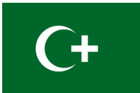
Le drapeau de la révolution égyptienne de 1919 contre l'occupation anglaise

Les deux expressions politiques de l'opposition les plus reconnues internationalement sont les Frères musulmans (une vieille organisation d'idéologie fondamentaliste islamique) et le diplomate Mohamed El Baradei (ancien président de l'Agence internationale de l'énergie atomique). Ces secteurs n'ont rejoint les manifestations que plusieurs jours après que celles-ci avaient commencé. Actuellement, ils y participent et ils essaient de les diriger en prenant part aux mobilisations, dans le but d'acquérir une légitimité politique et d'essayer de les mener vers une négociation politique avec le régime, et de représenter le mouvement