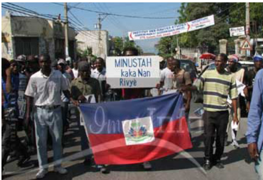
La Minustah a chié dans la rivière...

Les usines de textile requièrent peu de qualification technologique pour leurs salariés et il n'est donc pas