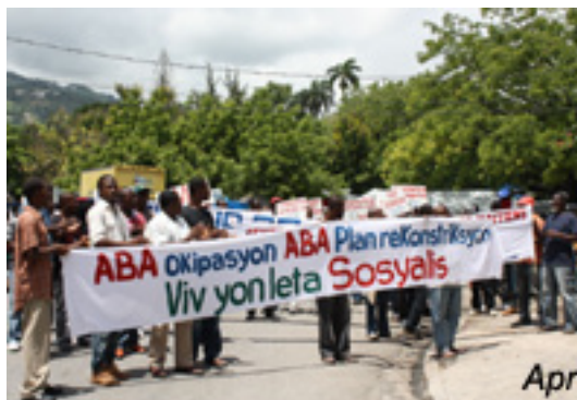
A bas l'occupation, a bas le plan de reconstruction. Vive l'Etat socialiste.

Il est temps de transformer la solidarité en Haïti en une grande campagne pour le retrait immédiat des troupes de la MINUSTAH du pays. Haïti n'a pas besoin de troupes étrangères, mais de médecins, d'infirmières, d'aides-soignants et de médicaments.